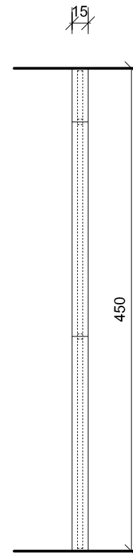
przekrój, skala 1:50